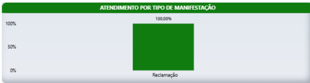
Relatório Ouvidoria 2026 - Portal da Transparência

Os meios de comunicação mais utilizados para registro das manifestações direcionadas ao Serviço de Ouvidoria no período foram: Portal da Transparência e e-mail.