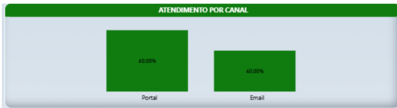
Relatório Ouvidoria 2026 - Portal da Transparência

Os meios de comunicação mais utilizados para registro das manifestações direcionadas ao Serviço de Ouvidoria no período foram: Portal da Transparência e e-mail.